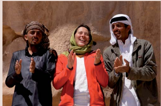
Auch wenn wir uns sprachlich nicht verständigen konnten – beim gemeinsamen Singen und Tönen entstand eine Verbundenheit und Freundschaft, die bis heute anhält.

Während dieser Gruppenreise entstand eine Freundschaft zwischen den Beduinen und mir. Wir konnten uns fast nichts von einander erzählen, aber von Anfang an kommunizierten wir über die Herzenssprache und das gemeinsame Singen. Es riss mir fast das Herz heraus, als wir uns vor der Felsenstadt Petra verabschieden mussten und ich meine lieb gewonnenen Freunde davonreiten sah. Ich wusste noch nicht, dass es kein Abschied war, sondern erst der Anfang meiner Zeit bei den Beduinen.