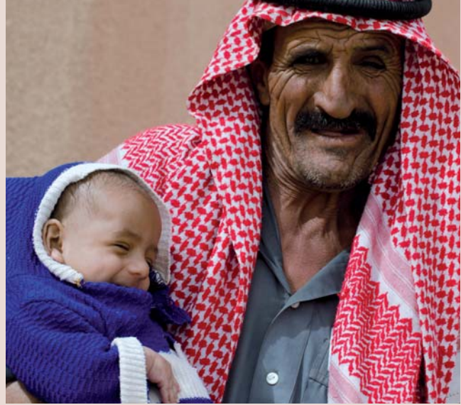
Beduinenhochzeit im März 2014: Beim fröhlichen Fest präsentiert der Brautvater stolz seinen eigenen, jüngsten Nachwuchs...