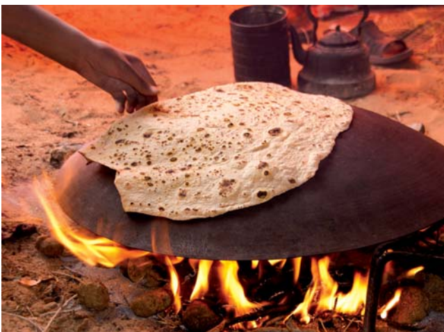
Brotbacken für die Hochzeit: Für so viele Gäste braucht man mehrere Hände zum Kneten – und viel Teig, aus dem dann dünne Fladen gebacken werden.

Drei Monate später flog ich wieder nach Aqaba . Die Wiedersehensfreude war riesig. In den nächsten drei Wochen durfte ich mit den Beduinen leben und wurde mit dem Rest der Großfamilie bekannt gemacht. Mit ihnen zu reden oder nachzufragen, warum etwas so oder so gemacht wird, war aufgrund der Sprachbarrieren fast unmöglich. Ich hatte kein theoretisches Vorwissen über ihre Kultur – aber durch Beobachten lernte ich langsam zu verstehen.