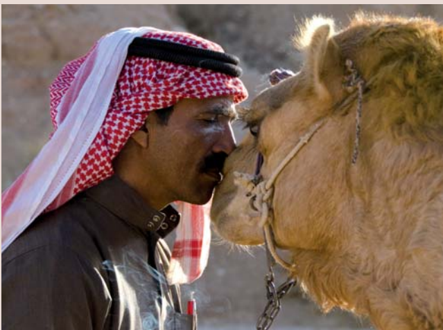
... und die Männer kümmern sich um Zucht, Pflege und Training der Kamele. Sie sind für einen Beduinen ähnlich wichtige Statussymbole, wie für Herrn Österreicher sein Auto.