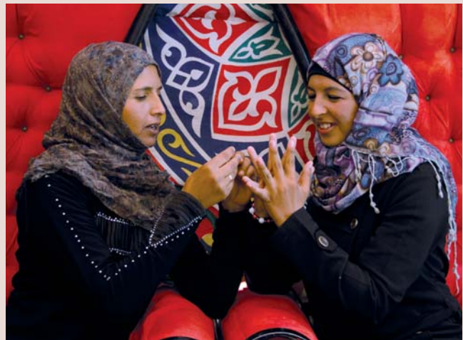
... und im bunten Hochzeitszelt spielen zwei junge Frauen auf dem Hochzeitsthron den rituellen Ringtausch nach.

Am nächsten Tag heißt es wieder Abschied nehmen.