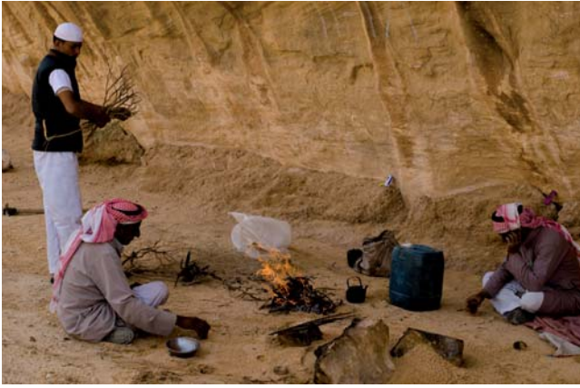
Reine Männersache: Während der Arbeit mit den Kamelen in der Wüste suchen sich die Beduinen ein lauschiges Plätzchen und genießen ihre Mittagspause.